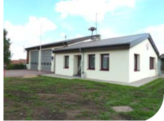
Caserne des pompiers Page 2