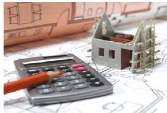
Urbanisme Page 4