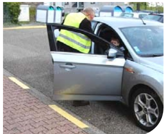
Ecoles Page 3