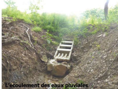
L'écoulement des eaux pluviales