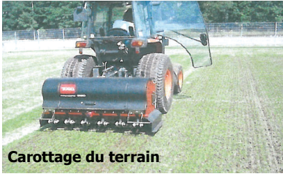
Carottage du terrain