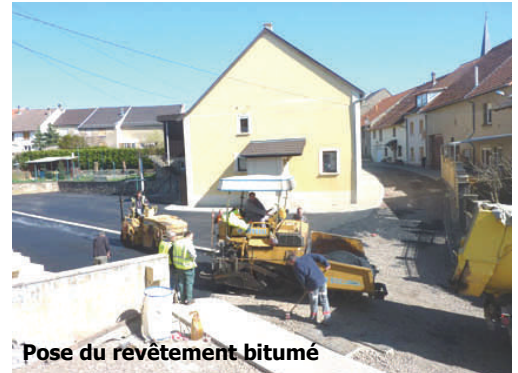
Pose du revêtement bitumé